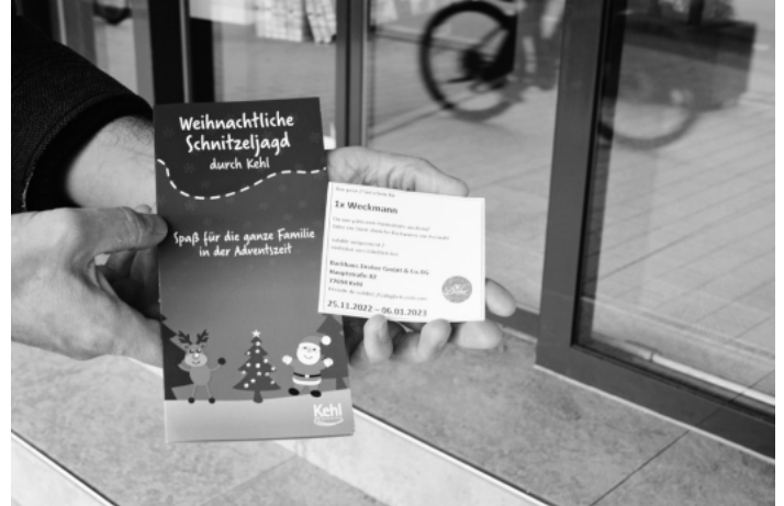
Wer den Lösungssatz errät, erhält einen Gebäckgutschein für die Dreher-Filiale in der Hauptstraße 82.

ße 78 abholen. Die Tourist-Information ist aufgrund der städtischen Energiesparmaßnahmen in dieser Zeit geschlossen.