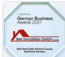
IMA Immobilien wurde als Bester Makler in Südwestdeutschland ausgezeichnet.