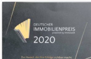
Verschiedene Auszeichnungen machen den Erfolg von IMA Immobilien sichtbar, hier vom Portal Immowelt.