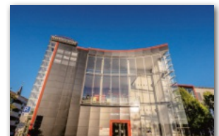
Im Nestler-Areal ist das seit 50 Jahren bestehende Unternehmen IMA Immobilien ansässig.